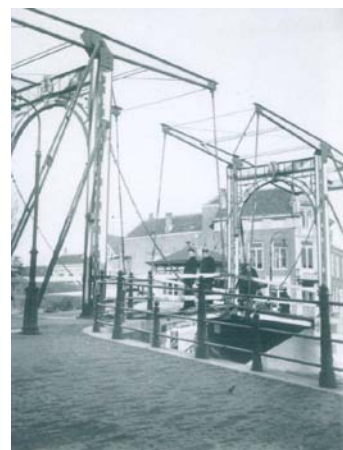
Welke brug is dit?

We hebben het fotomateriaal van het leven langs de Vliet in verschillende rubrieken ondergebracht. De Vliet werd in deze periode voor vele doeleinden gebruikt. Deze expositie brengt u terug naar het dagelijks leven op en rond de Vliet omstreeks 1900. Zo treft u foto's aan van de Vliet als recreatieplaats, de Vliet als vervoersader, de huizen en de industrie langs de Vliet en niet te vergeten de bruggen uit deze tijd. Het geheel geeft in vele opzichten de zo typerende smaak van onze voorouders weer. Wij hopen u bij onze expositie te mogen ontmoeten.