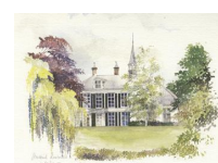
Te Werve 10