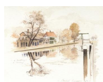
Middendorp bij Kerkbrug 7