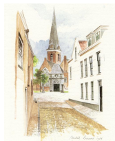
Oude Kerk 2