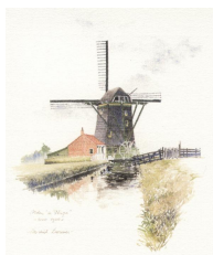
Molen 'De Vlieger' 1

Normale prijs per stuk €4,00 Tijdens Lustrum op vertoon van donateurskaart €3,50