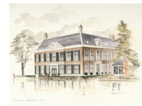
In de Wereldt is veel gevaer 5